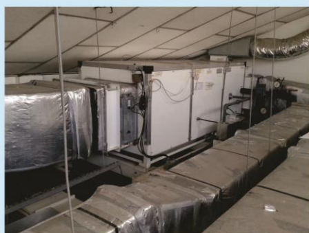
UNIDADE DE TRATAMENTO DE AR