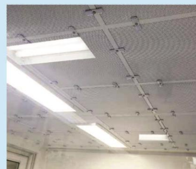
FORRO FILTRANTE CLASSE B

GRANULAÇÃO ESTERILIZAÇÃO DESPIROGENIZAÇÃO PESAGEM